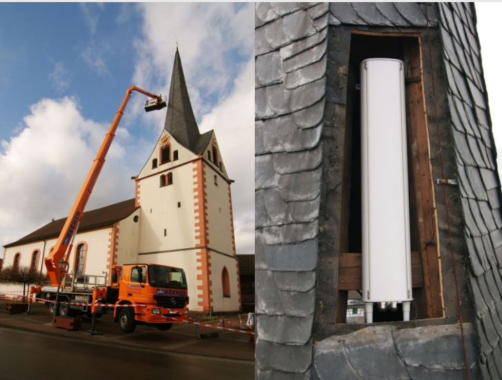
Einrichtung des Funksenders in Willstätt (Januar 2008)

per Fax: (07171) 917-140 oder E-Mail: Tagung@lel.bwl.de