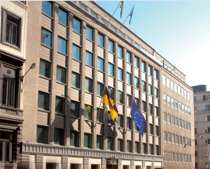
Representation of the State of Baden-Württemberg to the EU, Brussels

per Fax: +49 (0) 7171 917-140 oder E-Mail: Tagung@lel.bwl.de