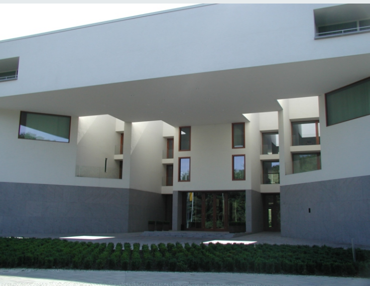
Landesvertretung Baden-Württemberg, Berlin

per Fax: (07171) 917-140 oder E-Mail: Tagung@lel.bwl.de