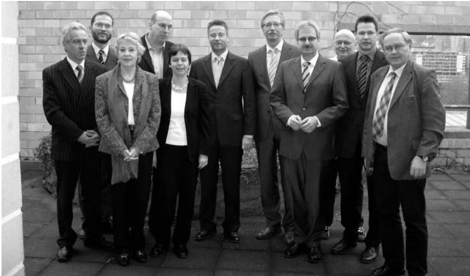
Die Mitglieder der Clearingstelle Neue Medien im Ländlichen Raum: